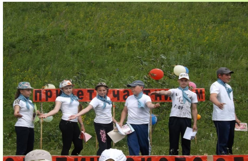
Визитка «Мы расскажем о себе»