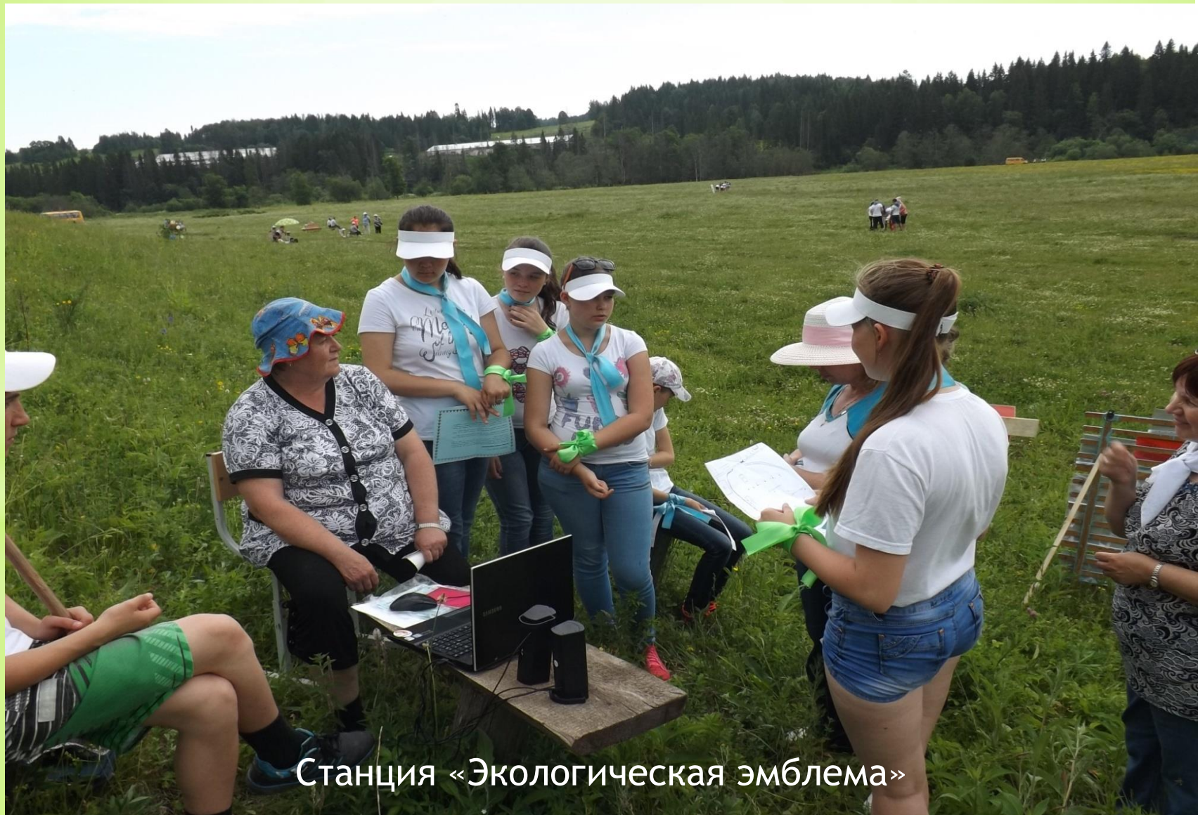
Станция «Экологическая эмблема»

Эколога - туристическая эстафета по экологическим станциям