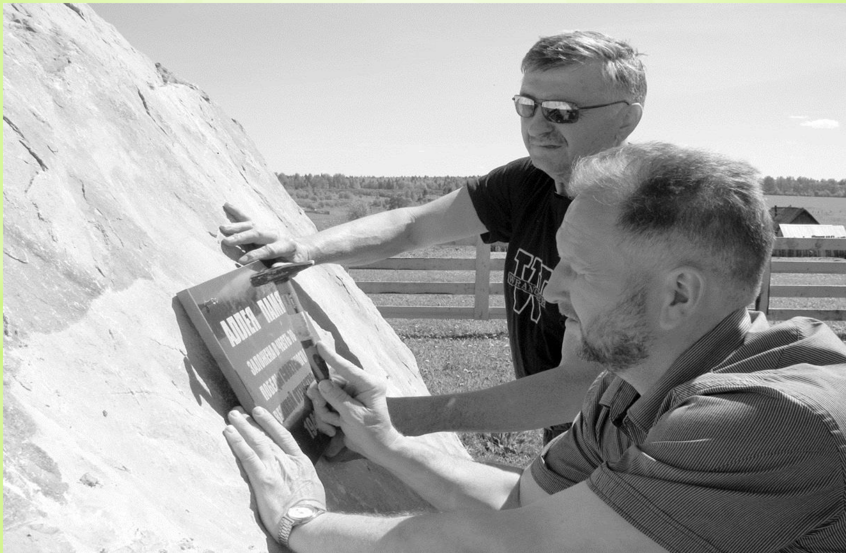
Участники закладки «Аллея Памяти»