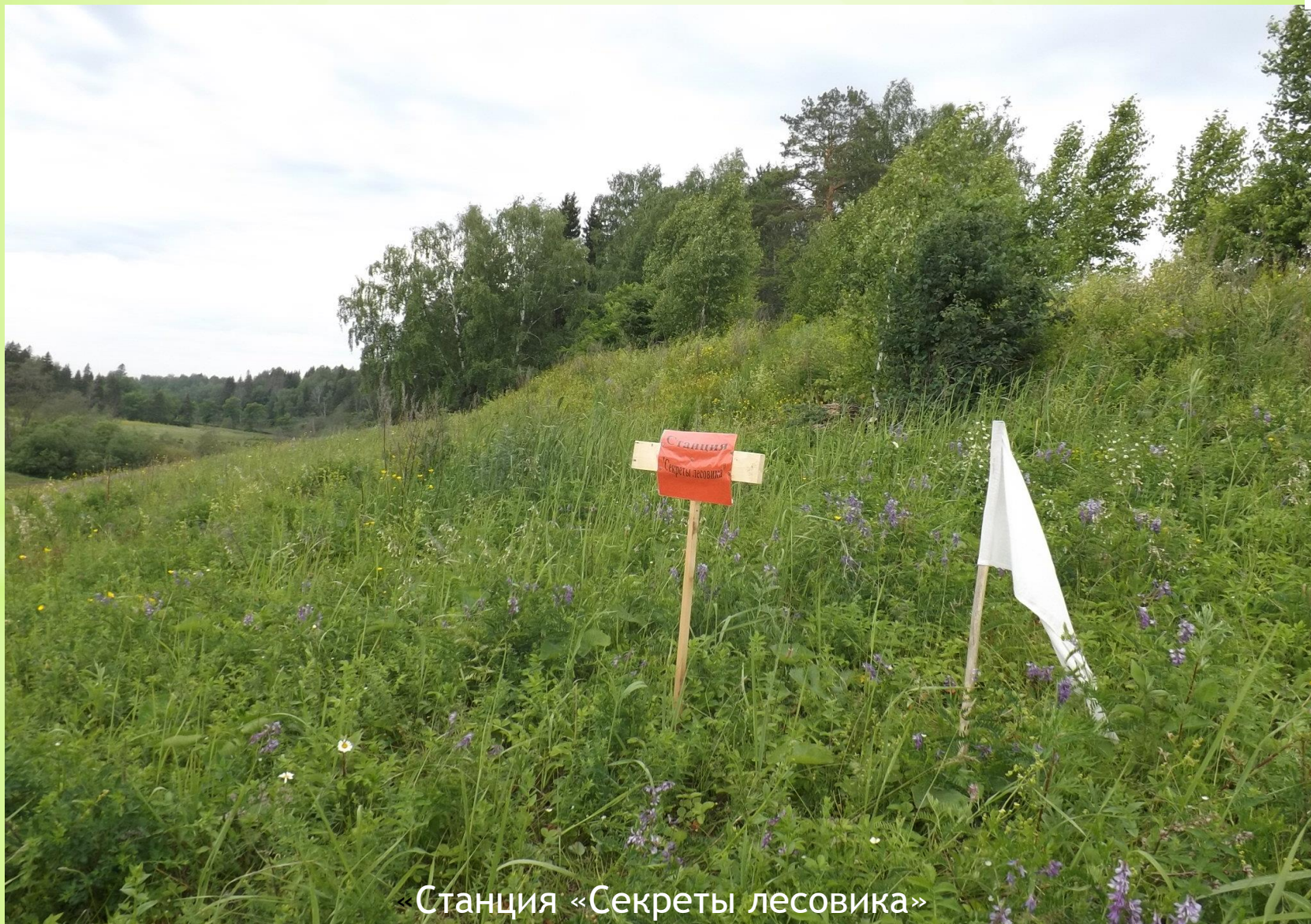
«Станция «Секреты лесовика»»

Эколого - туристическая эстафета по экологическим станциям