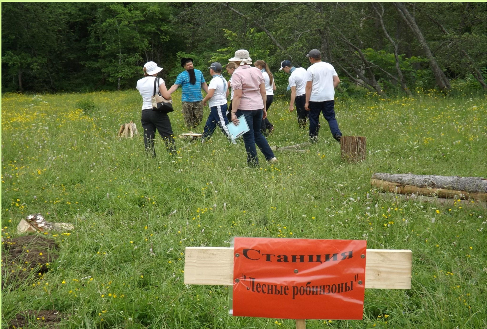
Эколого - туристическая эстафета по экологическим станциям