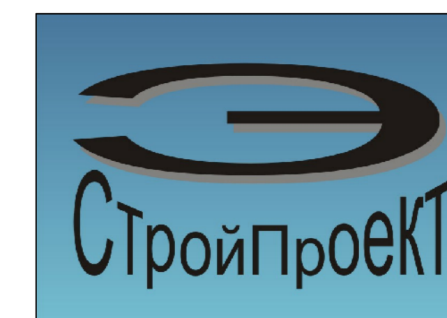
СХЕМА ТЕРРИТОРИАЛЬНОГО ПЛАНИРОВАНИЯ ПРЕДВАРИТЕЛЬНОЕ ПРЕДЛОЖЕНИЕ ПО ОПТИМИЗАЦИИ ГРАНИЦ ТЕРРИТОРИЙ ОКТАБРЬСКОГО, ЧЕРНУШИНСКОГО И УИНСКОГО МУНИЦИПАЛЬНЫХ РАЙОНОВ